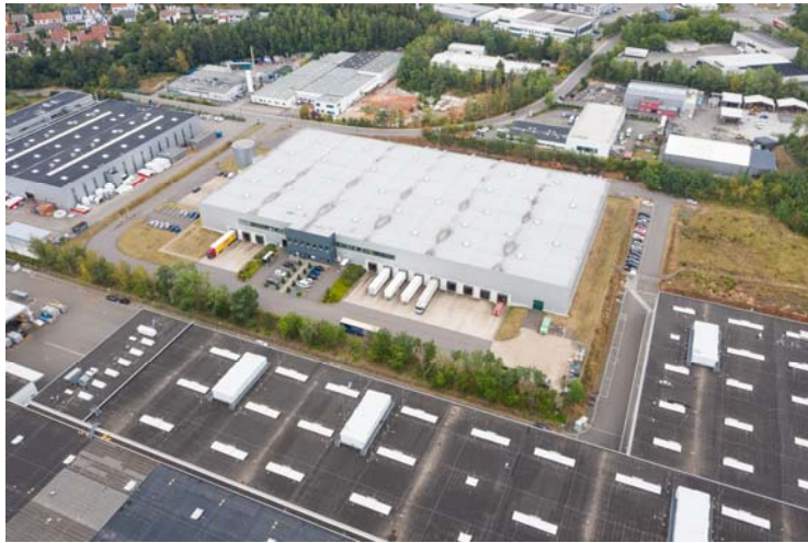
Logistikimmobilie im saarländischen Neunkirchen, Im Langental 8

Frankfurt am Main/Neunkirchen, 16. Dezember 2020 – Die confid logistics GmbH hat insgesamt rund 13.930 Quadratmeter Fläche im saarländischen Neunkirchen, Im Langental 8, gemietet. Darunter sind rund 12.400 Quadratmeter Hallen-, circa 890 Quadratmeter Mezzanine-, also Arbeits- und Büroflächen, die sich auf Zwischenebenen oberhalb der Hallenflächen befinden, und rund 640 Quadratmeter Bürofläche.